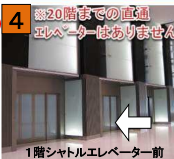
1階から15階までのシャトルエレベーターがあります。15階までお越し下さい。