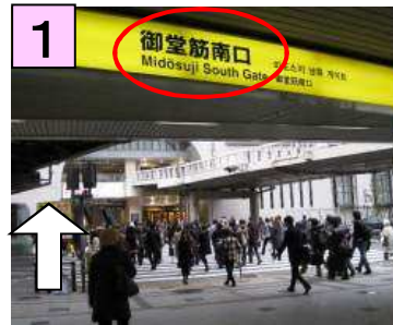
御堂筋南口から阪急百貨店へ続いている横断歩道を渡ります。