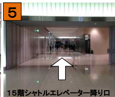
15階シャトルエレベーター降り口からそのまま正面へお進み下さい。