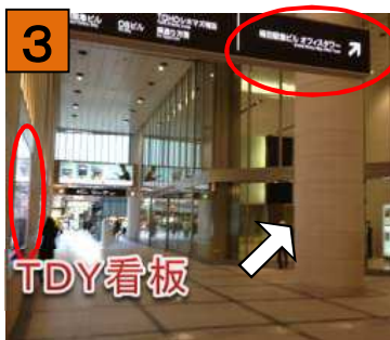
ツインタワーズ入口がありますので、中にお進み下さい。入口前にはTDY看板があります。