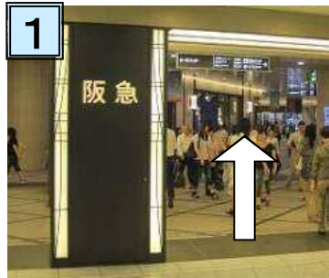
南改札口を左にでると阪急百貨店の地下入口が見えます。つきあたりまでお進み下さい。