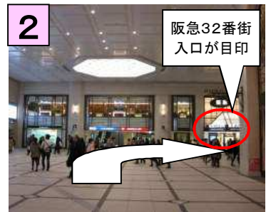
そのまま直進すると右側に阪急32番街入口が見えてきます。入口前を通路に沿ってお進み下さい。